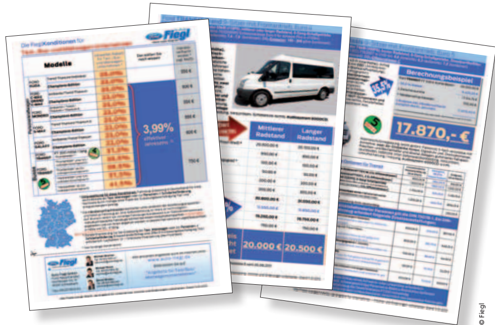
Das Angebot von Fiegl reicht vom Grand C-Max bis zum 17-sitzigen Ford Transit

10. November 2012 Köln, Messegelände, Kristallsaal