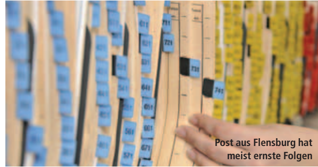
Post aus Flensburg hat meist ernste Folgen

Unter gewissen Umständen muss ein Fahrverbot keine Kündigung für einen Kraftfahrer nach sich ziehen.