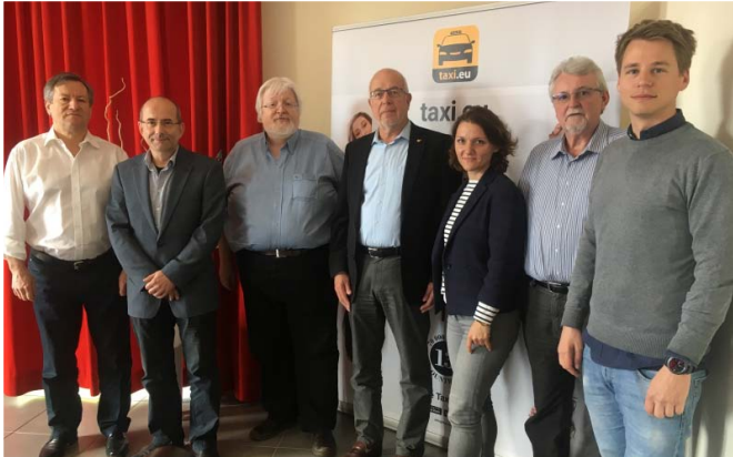
Das BZP-Präsidium und die Führungsspitze von CleverShuttle nach dem intensiven Meinungsaustausch in Berlin

Oder werden sie zur Bedrohung für die Taxi-Branche?