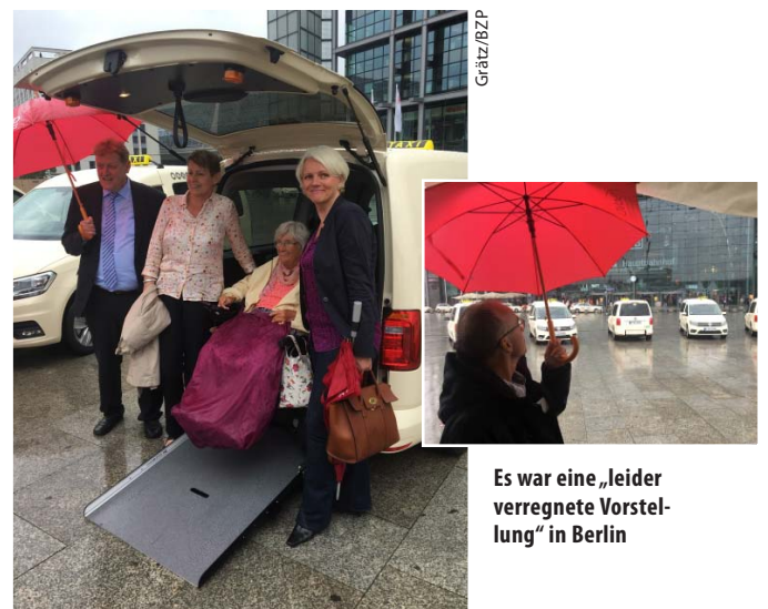
Es war eine „leider verregnete Vorstellung“ in Berlin