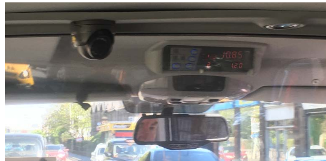
Blick in ein Taxi im schottischen Edinburgh - natürlich mit Überwachungskamera

Grundlagen der Videotechnik Zwar kann nicht jeder die nächstbeste Kamera aus dem Elektronikmarkt in sein Auto einbauen und munter drauflos filmen. Videoüberwachung zu Verhaltenskontrollen der Fah-