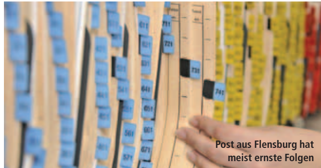
Post aus Flensburg hat meist ernste Folgen

Unter gewissen Umständen muss ein Fahrverbot keine Kündigung für einen Kraftfahrer nach sich ziehen.